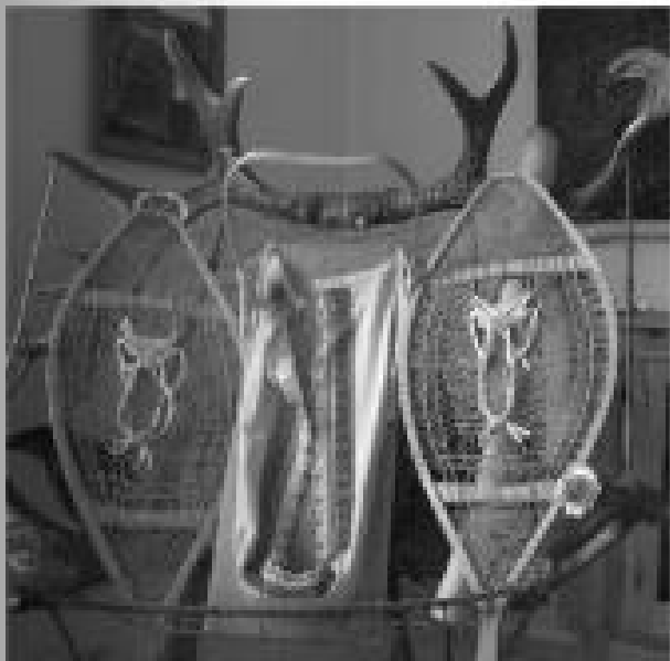
À Manawan, plusieurs, septans et parcs-bios.

Tous les ans, Manawan brasse une tournée touristique offre de visites à travers les régions. La petite communauté de la région québécoise — 80 % de la population a moins de 35 ans — est une véritable locomotive de découverte culturelle et de partage avec grande fierté de sa fierté pour être « chez » une destination touristique internationale au cœur de ses traditions.