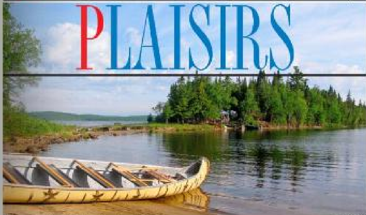
Manawan, un paysage traditionnel attikamek entouré sur un lac au milieu des forêts.

JARDINS Grand lauréat d'été dans les plates-bandes Page 11